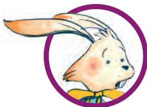
IL CONIGLIO BIANCO È sempre di corsa e in ritardo