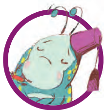
IL BRUCO Dà ad Alice un fungo che fa ingrandire e rimpicciolire