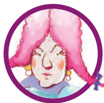
LA DUCHESSA Culla uno strano «bambino»